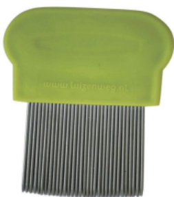
Metalen netenkam= behandel kam